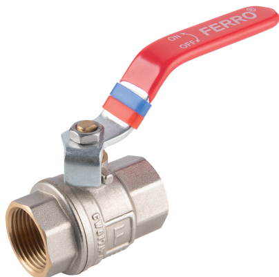
KFP Kulový plnopřůtočný kohout, páka Full-flow ball valve, lever • PN 30, Typ MM • PN 30, Typ FF