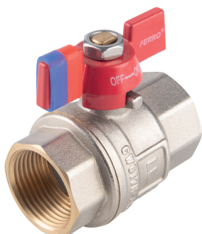
KFPM Kulový plnopřůtočný kohout, motýlek Full-flow ball valve, butterfly handle - PK 30 Typ MM - PK 30 Typ FF