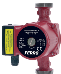
W0204 Oběhová čerpadla FERRO pro pitnou vodu