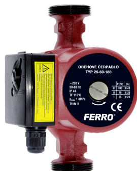
W0202 Oběhová čerpadla FERRO pro pitnou vodu